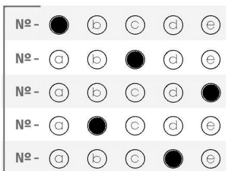
figura 02 - preenchimento CORRETO de cartão-resposta Ensino Médio